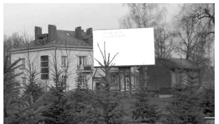
Lauko ekrane laikas rodomas tokiomis mažiškais skaičiais, kad nejučia gali kilti noras apsilankyti vietos okulistus.