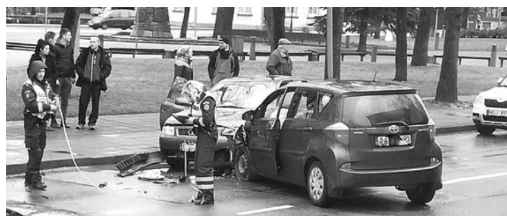
Nors mieste automobiliai važiavo nedideliu greičiu, į avariją patekusios transporto priemonės apgadintos gana stipriai.

Gerai informuoti „Anykštos“ šaltiniai pasakojo, kad „Toyota“ automobilį vairavusią moterį ištiko priepuolis ir ji trumpam neteko sąmonės. Moteris tuo metu