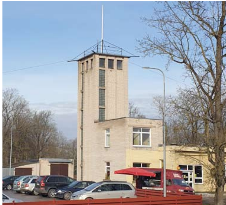
Ant senosios gairinės bokšto jau sumontuotas 5 m ilgio vėliavos stiebas, kurį dovanojo „A. ir A.A. Avižienių fondas“.